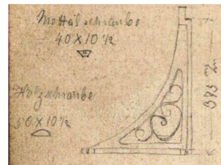
Detail aus dem Skizzenbuch von R. Alder-Fierz