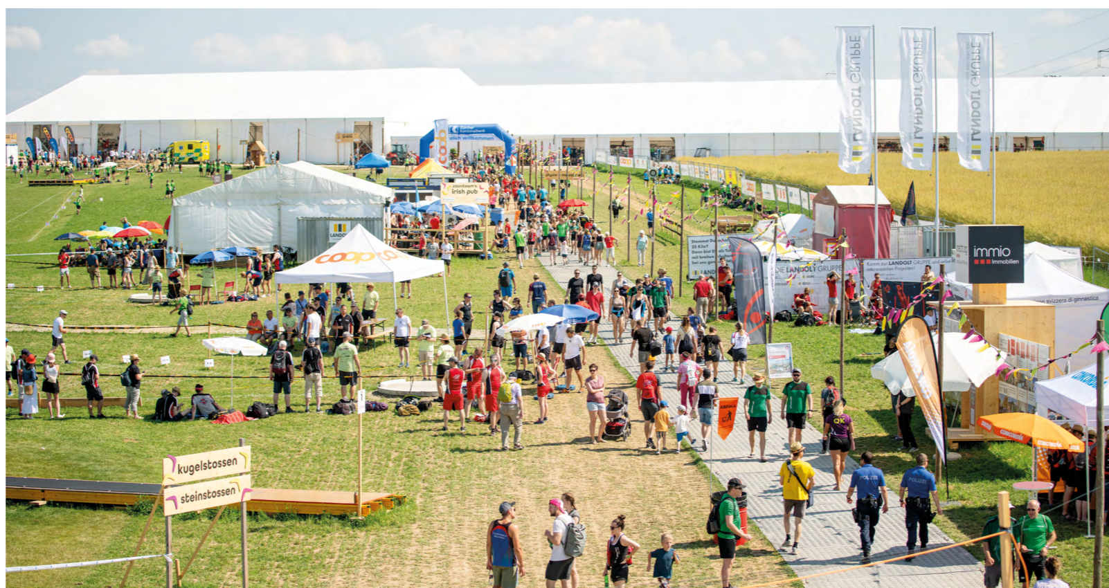
Turnfest Atmosphäre