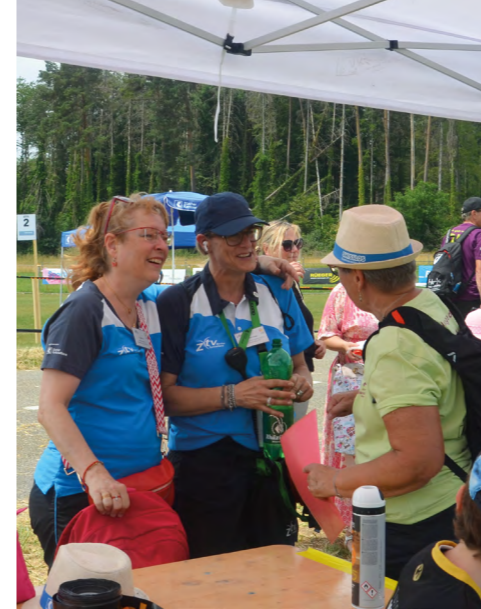
Im Gespräch mit Wettkampfleitung und Richter