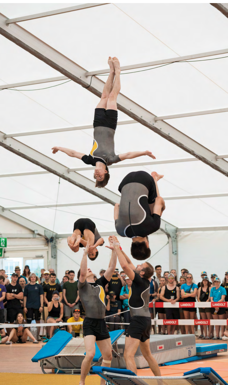
Gerätekombination TV Wetzikon

Geht es euch auch so, dass ihr immer wieder ans Zürcher Kantonturnfest Wyland 2023 zurückdenkt? Einfach unglaublich, was für wunderbare Wochenende und Tage wir alle erleben durften. Nicht zuletzt dank der grossen Zahl an eindrücklichen Fotos, können wir in unseren Erinnerungen schwelgen. Was da für ein Strauss an bunten Bildern entstanden ist, ist grossartig. Da Bilder oft mehr sagen als 1000 Worte teilen die KTF Wyland Fotografen ihr persönliches Lieblingsujet mit euch. In persönlichen Rückmeldungen von Beteiligten soll natürlich auch das Wort nicht ganz vergessen gehen.