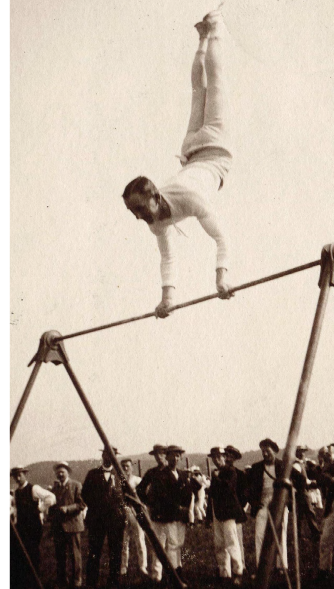
Turner am Universalturngerät als Reck

Das Turngeräte-Museum von Alder + Eisenhut in Ebnat-Kappel im Toggenburg ist das ideale Ausflugsziel für Vereine und Familien. Turngeräte, Fotografien, Filme und historische Bücher lassen als Zeitzeugen in die damalige Welt des Turnens eintauchen und wecken zugleich Erinnerungen und Emotionen. Zu den Hauptattraktionen gehören neben dem Universalturngerät ein Pauschenpferd von 1730 und ein Gerpfahl aus dem 19. Jahrhundert.