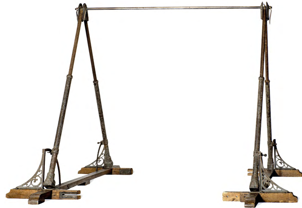
Das Universalturngerät in der Konstruktion von Robert Alder-Fierz mit den dekorativen Elementen.

Im Turngeräte-Museum von Alder + Eisenhut kann das Universalturngerät bestaunt werden. Dieses ist ein Unikat und steht exemplarisch für die Zeit des sich neigenden 19. Jahrhunderts. Dass Turnvereine finanziell nicht auf Rosen gebettet sind, ist eine ebenso alte Wahrheit, wie dass Not erfinderisch macht. Auch Emil Trachsler wurde 1884 erfinderisch, als er Turngeräte für seinen Turnverein beschaffen wollte.