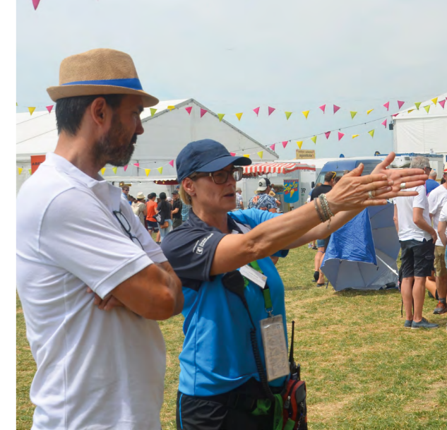
Im Gespräch mit Sponsor