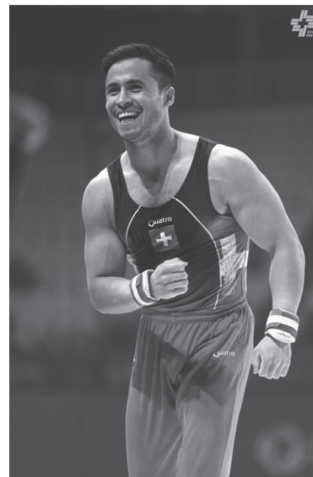
EM 2023