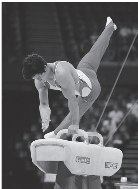
Junioren EM 2012

besser werden würden, sehe er als wenig realistisch, weshalb er jetzt einen Schlussstrich unter seine sehr erfolgreiche Kunstturn-Karriere zieht.