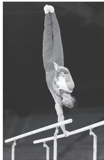
Olympische Spiele 2021

Freunde und Freundin, welche ihn während seiner Karriere unterstützt und mit ihm mitgefiebert haben: «Ein grosses Dankeschön geht auch an die vielen Ärzte und Physiotherapeuten, die mich seit Anfang unterstützt haben und immer wieder hervorragende Arbeit geleistet haben.»