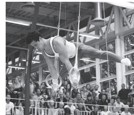
SMM 2015

Seinerseits einen grossen Dank richtet Eddy Yusof an sein nahes Umfeld, Familie,